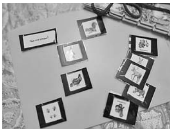
Рисунок 12. Пример адаптации блокнота.

Вырежьте картинки с заданием, наклейте их на квадратики не отвлекающего от рисунка цвета и заламинируйте скотчем. Такие карточки будут предназначены для многоразового использования.