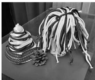
Рисунок 3. Мастер-класс «Деревья тайги», вариант «Березка»