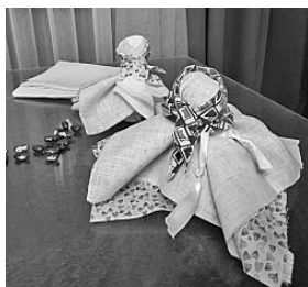
Рисунки 10–11. Мастер-класс «Куклы-ягодки» (адаптация)