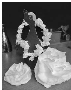
Рисунок 9. Мастер-класс «Глухарь» (адаптация)

6. Украсить хвост и крылья можно белой гуашью при помощи кисти. Или приклеить по краю хвостика и крылышек маленькие комочки из бумажной салфетки.