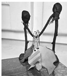
Рисунки 6–7. Мастер-класс «Река с рыбками». Варианты «Рыбка», «Сушилка для рыбы» (адаптация)