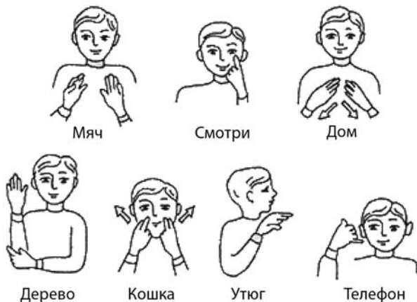
Пример простой жестовой речи