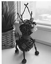
Рисунок 2. Мастер-класс «Олень из шишек» (адаптация)

6. Мордочку можно сделать любую, самую простую, с которой справится ваш подопечный. Для изготовления поделки на рисунке 2 использовались два небольших синих шарика пластилина – это глазки и небольшой белый кусочек пластилина в форме сердечка – это ротик. Также из белого пластилина выполнены ушки. Дополнительно мордочка украшена бусинками, но этого можно и не делать.