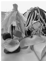
Рисунки 4–5. Мастер-класс «Деревья тайги», вариант «Хвойное дерево». Мастер-класс «Грибная поляна»